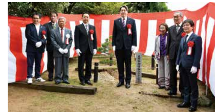
松原市緑花協会50周年記念事業 松原市緑花協会が白松の顕彰碑除幕式及びウツクシマツの植樹式を開催しました。当日は市長をはじめとした来賓の皆様が見守る中、当協会設立50周年を記念して建立された顕彰碑などが披露されました。(4月23日)