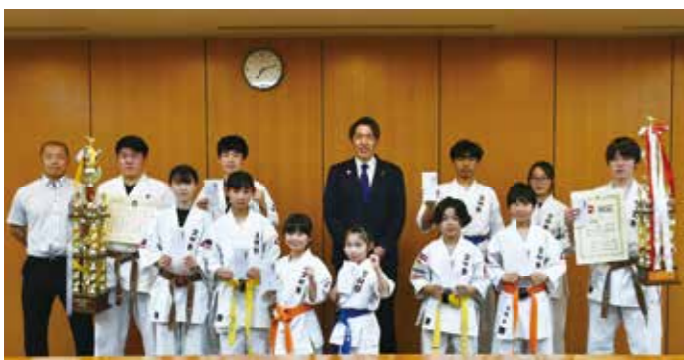
西田道場の皆さん 「第9回全日本少年少女空手道選手権大会/第4回全日本高等学校空手道選手権大会リアルチャンピオンシップ決勝大会」出場