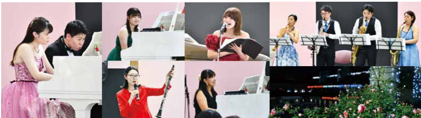
第24回松原市民バラフェスティバル 各種団体のご協力を得て、市の花である「バラ」が庁舎を彩る中、「バラいっぱい寄附金」にご協力いただいた皆さんをはじめとする、市民の皆さんへの感謝の気持ちを込めた松原市民バラフェスティバルを開催しました。ロビーコンサートや第39回わんぱく相撲まつばら場所へ、たくさんの皆さんにご参加いただき大盛況でした。 また、バラフェスティバル開催週の月曜日から土曜日までの夜間には市庁舎がイルミネーションで彩られました。(5月18・19日)