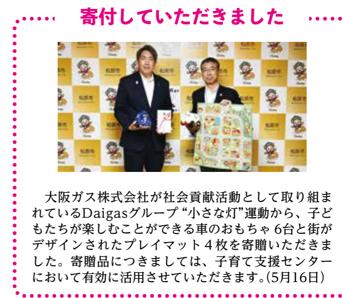
寄付していただきました 大阪ガス株式会社が社会貢献活動として取り組まれているDaigasグループ“小さな灯”運動から、子どもたちが楽しむことができる車のおもちゃ6台と街がデザインされたプレイマット4枚を寄贈いただきました。寄贈品につきましては、子育て支援センターにおいて有効に活用させていただきます。(5月16日)