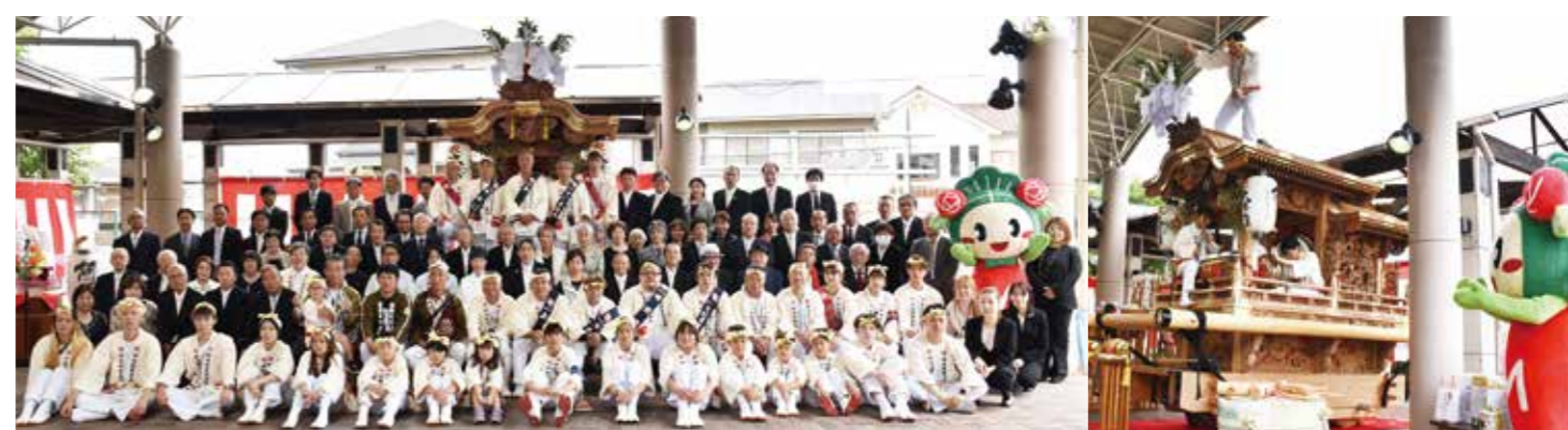
阿保地車が大修復により美しい姿に！ 阿保地車保存会保有の地車が披露されました。文化庁の地域文化財総合活用推進事業を活用した半年に及ぶ大修復を終え、美しい姿に生まれ変わりました。現在、阿保神社では、松原市観光協会との連携イベントも企画されており、今後阿保地区ではイベントが盛んに行われることが期待されます。(5月12日)