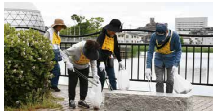
みんなで作る きれいな松原 「きれいなまちづくり美化キャンペーン」を市内全域で行いました。各町会では約4,300人の参加のもと、地域清掃が実施されました。また、市役所周辺にも約200人の事業者・各種団体・個人ボランティアの人が参加し、市内主要道路の清掃、河内松原駅前での啓発活動を行いました。(5月12日)