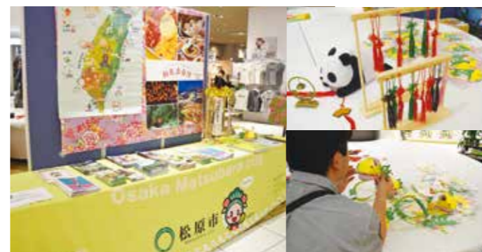
松原で“ビビビビ！台湾” ～友好協定締結10周年記念企画第1弾～ 台湾観光協会の協力のもと「松原市×台北市文山区友好交流協定締結10周年イベント」をセブンパーク天美で開催しました。イベントブースでは10年間の交流報告や、龍のミニランタンづくりなど、多くの人に松原で台湾を感じてもらえました。(5月18・19日)