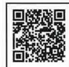
違反対象物公表制度