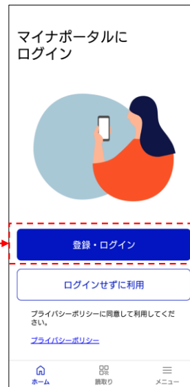
マイナポータルログイン