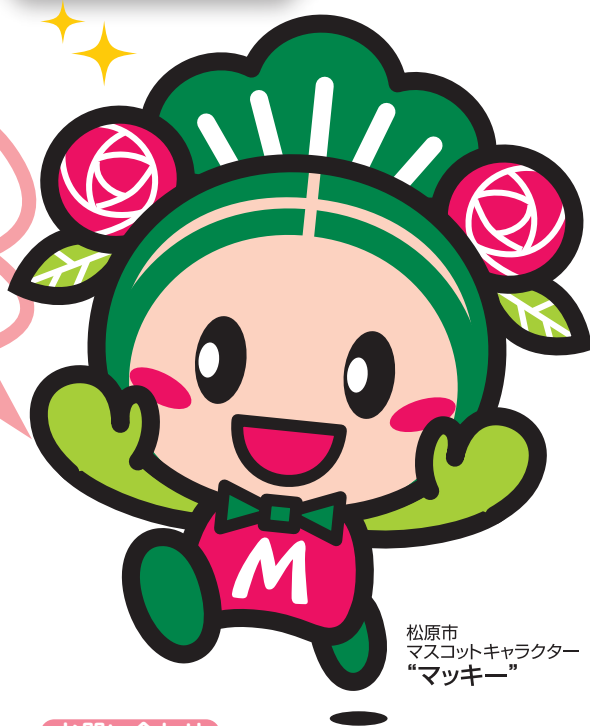
松原市 マスコットキャラクター “マッキー”