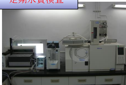
河南水質管理ステーション

河南水質管理ステーションとは 水質管理の向上と強化、また人員及び機器の集約による効率化を図るために、大阪広域水道企業団と松原市を含む近隣の10市町村が共同で平成25年度に設立した組織のこと。